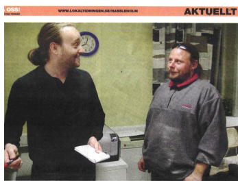
Män hjälper män i samtal "Vi har inte pratat om bilar och idrott en enda gång"

goda exempel . I den handledning jag har med olika behandlingshem och lä-